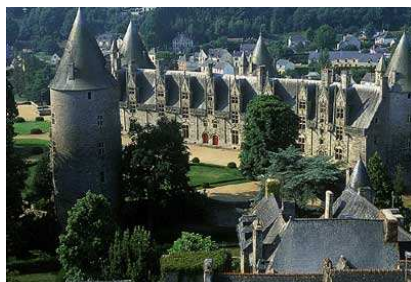
Château de Josselin

L'Oust canalisée offre un axe paisible via son chemin de halage, bordés de châteaux tels le Château du Crévy à MONTERTELOT ou celui des Ducs de Rohan à JOSSELIN.