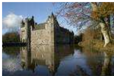
Château de Trécesson à CAMPENEAC

A CAMPENEAC, vous pourrez faire une pause au château de Trécesson. Histoires et légendes hantent les lieux. Ainsi celle des abeilles, attirées par le parfum de toutes les dames qui ont séjourné ici, et qui meurent de l'avoir respiré.