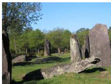
Ensemble mégalithique de MONTENEUF

Les mégalithes sont également présents dans ce paysage. A MONTENEUF, le site des Pierres Droites offre un ensemble d'une quarantaine de menhirs relevés faisant partie d'un ensemble dont l'organisation pouvait représenter une véritable « cathédrale mégalithique ».