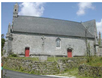
Chapelle Ste Brigitte à Loperhet